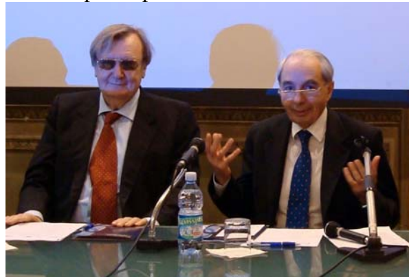
Prof. Carlo Rubbia e il Min. Giuliano Amato durante una conferenza Fulbright

Abbiamo tra i nostri ex borsisti dell' epoca tre premi Nobel: Tullio Regge , Carlo Rubbia , e Riccardo Giacconi . Sempre nel campo delle scienze credo che anche i non iniziati conoscano il nome dell'astronoma Margherita Hack . Passando ad altri campi vorrei accennare al regista teatrale Luigi Squarzina , all' architetto Gino Valle , al politologo Gianfranco Pasquino . Tralascio gli ex borsisti che in diversi periodi hanno fatto parte del Parlamento, tornando poi alle loro occupazioni professionali. Nel mondo politico attuale Giuliano Amato e Lamberto Dini , graduate students dei miei tempi, occupano posizioni di primo piano.