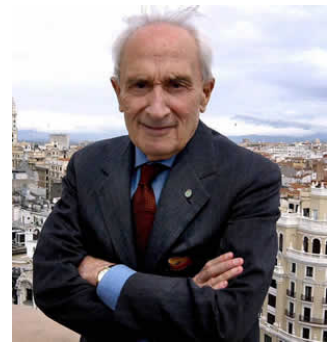
Prof. Giovanni Sartori