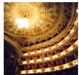
Il Teatro di Spoleto

Invece, per quel che riguardava i graduate students americani, non essendovi allora corsi post-laurea presso le università italiane, il nostro ufficio, oltre all'affannosa ricerca di alloggi per i Fulbright non inclini al pittoresco scomodo, li affidava a singoli professori i cui campi fossero più affini ai loro progetti di studio. Nel caso degli artisti, cercavamo il pittore o lo scultore o il musicista che fosse disposto a seguirne le