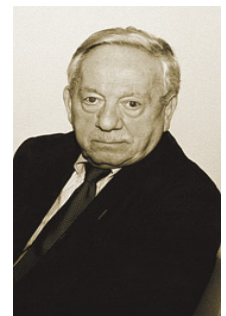
Prof. Joseph La Palombara

A prescindere dalla curiosità generica, vi erano allora già vari borsisti americani specializzati in storia contemporanea e scienze politiche. Molti conosceranno il nome del Prof. Joseph Lapalombara, ora "emerito" a Yale, autore di importanti opere sull'Italia contemporanea, che per decenni è stato interpellato da TV, giornali e riviste quale migliore interprete della politica italiana in America e della politica americana in Italia. Joseph Lapalombara venne in Italia nel 1952 come graduate student Fulbright di scienze politiche con l'intento di studiare i problemi del lavoro e i sindacati italiani. Questo progetto richiedeva ovviamente approfonditi contatti con le organizzazioni del lavoro italiane di cui la CGL, allora prevalentemente di area comunista, era una delle principali. Gli studi poi pubblicati su questi argomenti e successivamente sui comportamenti elettorali italiani furono di fondamentale importanza per la comprensione da parte americana dei nostri problemi e dei comportamenti politico-sociali, comprensione che all'epoca era piuttosto rudimentale.