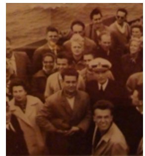
Fulbrighters in viaggio

In verità, tra i primi studenti americani venuti in Italia con le nostre borse, ce ne erano alcuni "anziani" (ventiseienni-trentenni) che erano stati nel nostro paese nell'ultimo anno di guerra come soldati di leva e che mi intimidivano molto: due di questi, appena arrivati, mi informarono che non avevano bisogno di aiuto per trovare alloggio, perché si erano già installati all'albergo Excelsior in Via Veneto, che "andava abbastanza bene". Non tennero alcun conto delle mie timide obiezioni con un accenno al fatto che l'albergo non era più requisito dall'esercito alleato: evidentemente non avevo un aspetto e modi abbastanza autorevoli. Naturalmente dopo due giorni comparvero a chiedere un anticipo sul loro successivo assegno mensile. A proposito di questo assegno, va notato che l'importo di 128.720 lire mensili era allora quanto mai cospicuo. I borsisti economi riuscivano a rimanere in Italia parecchi mesi dopo la fine della borsa, mentre gli spendaccioni potevano permettersi dieci giorni di sci a Zermatt o Cortina a Natale e soggiorni a Capri o Positano a Pasqua.