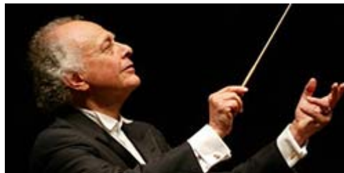
Il Maestro Lorin Maazel